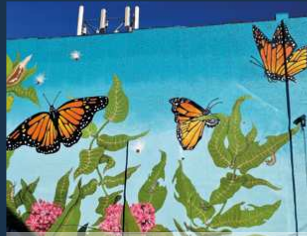
MURALE DE L'INSECTARIUM AND BUTTERFLY PAVILION

Avec plus de 3000 fresques murales répandues à travers la ville, vous pourrez certainement admirer, en vous baladant, quelques-unes de ces immenses oeuvres d'art. Ces fresques sont encouragées par un des plus importants programmes d'art public au pays, le Mural Arts Program , mis en place en 1984 par Wilson Goode, le maire de l'époque, afin d'offrir un encadrement aux artistes de la rue et ainsi enrayer un grave problème de graffitis.