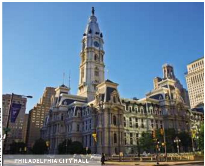
PHILADELPHIA CITY HALL