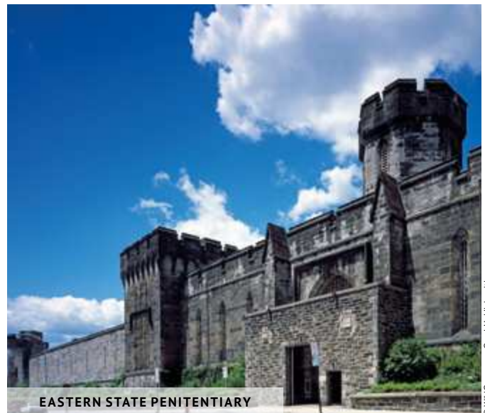
EASTERN STATE PENITENTIARY