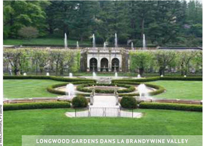
LONGWOOD GARDENS DANS LA BRANDYWINE VALLEY

Dans le comté de Lancaster ★★, la communauté amish , comptant 59 000 membres, vit en retrait de la société , sans électricité ni technologie, selon des valeurs traditionnelles orientées vers la terre et la famille . Le temps s'y est arrêté au 17 e siècle ! Il y a plusieurs petits villages intéressants à découvrir en empruntant les routes de campagne. Osez les parcourir et vous croiserez à coup sûr des attelages rudimentaires utilisés par les membres de la communauté comme moyen de transport. Vous pourrez peut-être aussi apercevoir des agriculteurs, travaillant avec leurs chevaux dans les champs. Les routes 30 et 340 sont celles où se concentrent le plus les Amish.