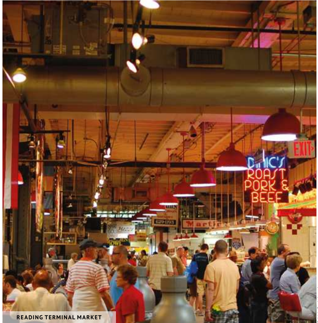
READING TERMINAL MARKET

3260, SOUTH STREET, PHILADELPHIE 215-898-4000/WWW.PENN.MUSEUM