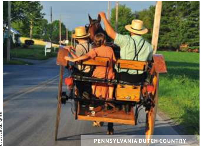
PENNSYLVANIA DUTCH COUNTRY