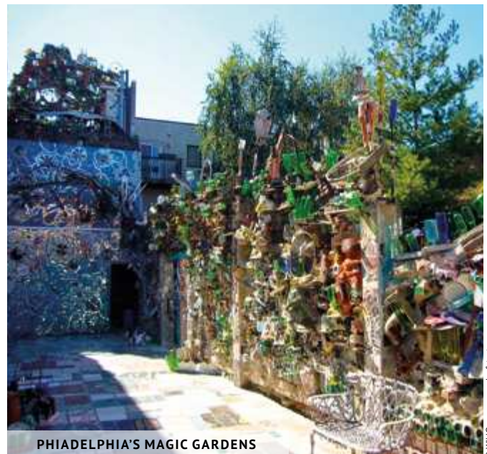
PHILADELPHIA'S MAGIC GARDENS

1020, SOUTH STREET, PHILADELPHIE 215-733-0390 WWW.PHILLYMAGICGARDENS.ORG