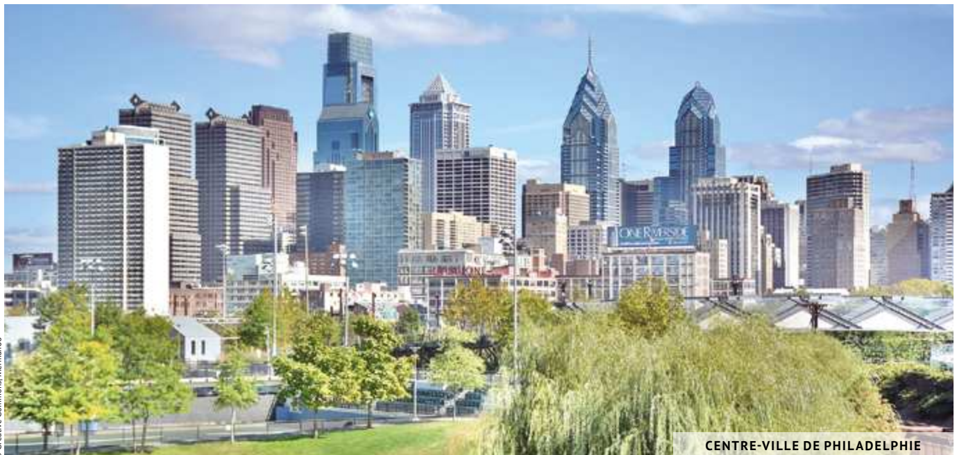
CENTRE-VILLE DE PHILADELPHIE